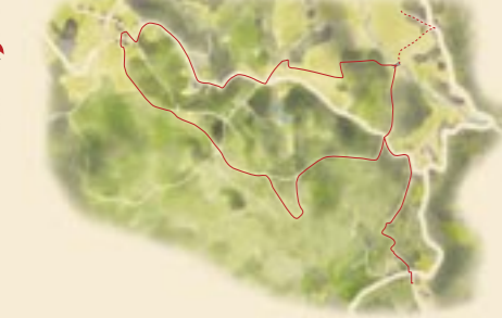
Voir la carte "Balades en Haute-Corrèze" offerte dans les Offices de Tourisme ou maires de la Communauté de Communes.